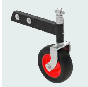
Accessorio ruote. Accessory wheels.