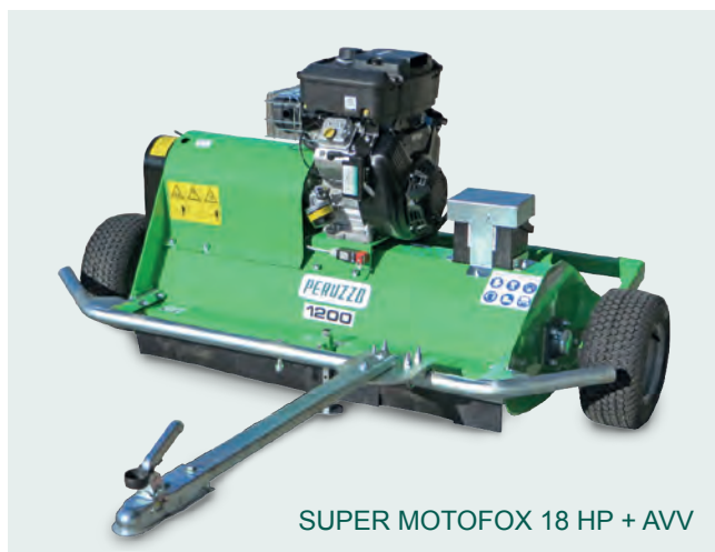
SUPER MOTOFOX 18 HP + AVV

La trinciaerba MOTOFOX è ideale per l'applicazione posteriore al gancio traino di QUAD – ATV e altri mezzi 4x4. Azionata da motori a benzina a marchio Honda e Briggs&Stratton da 13 a 18 CV di potenza, monta un interruttore di sicurezza azionabile dall'operatore in caso di emergenza dal posto di guida. La trinciaerba è dotata di puleggia centrifuga che tiene il rotore fermo quando è avviata a basso regime di giri, agevolando così l'accensione del motore. Per il traino della MOTOFOX la macchina dispone di un timone con gancio di traino a sfera a standard europeo, pieghevole e spostabile per uscita su carreggiata sia lato destro che sinistro. Prodotta negli stabilimenti Peruzzo, è disponibile esclusivamente nella versione 1200.