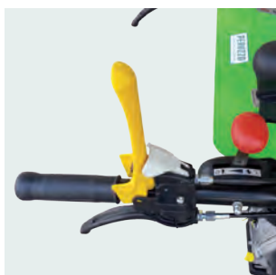
Manubrio ergonomico e regolabile con leve di sicurezza. Handlebar with ergonomic safety handlebar.