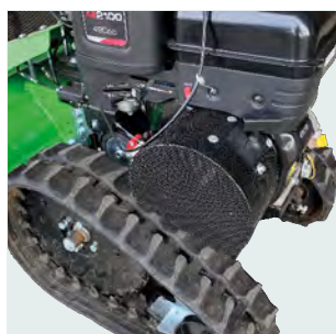
Protezione filtro aria. Air filter cover.