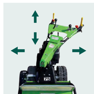
Manubrio ergonomico e regolabile in altezza e lateralmente. Ergonomic handlebar easily adjustable in height and sideways.