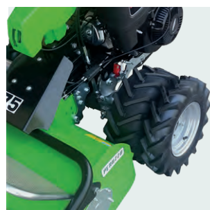
Ruote artigliate gemellari da 16". 16" double clawed wheels.