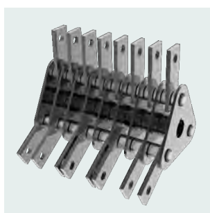
Gruppo a martelli di grosso spessore. Heavy duty hammer group.