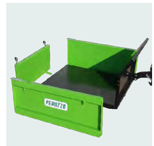
Pianale porta attrezzi (portata 350 kg). Tool platform (capacity 350 kg).