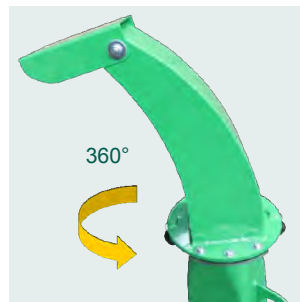
Curva di scarico orientabile a 360°. 360° adjustable outlet elbow.