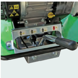
3 marce + retromarcia. 3 gear + reverse.