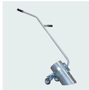
Tubo imboccatore in acciaio con ruote. Steel spout tube with wheels.