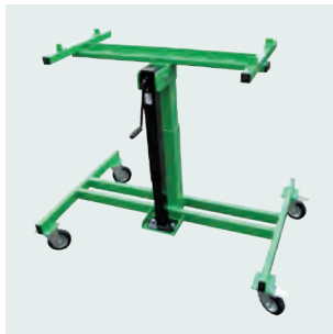
Carrello di aggancio e sgancio per sponde cassone. Lifting trolley for easy loading on truck sides.